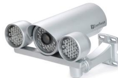
Kamera mit IR Strahler 08188280